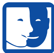
DIFFICULTÉS DE COMPRÉHENSION